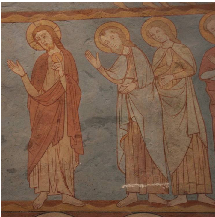
Détail du Christ, de saint Jacques et de saint Jean